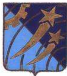
Le 1 er insigne de la BAO 132 homologué en 1958.

Certaines installations primordiales n'étaient pas encore installées. Les hangars avions, et les PC des escadrons n'étaient pas encore équipés de distributions de courant pour leur éclairage, ni de chauffage