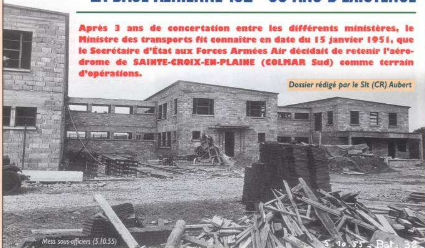
Mess sous-officiers (5.10.55)

Dès lors, le service technique des bases aériennes du Ministère des transports fut chargé de procéder à l'établissement de l'avant projet pour répondre aux nouveaux besoins formulés par l'État major de l'Armée de l'air.