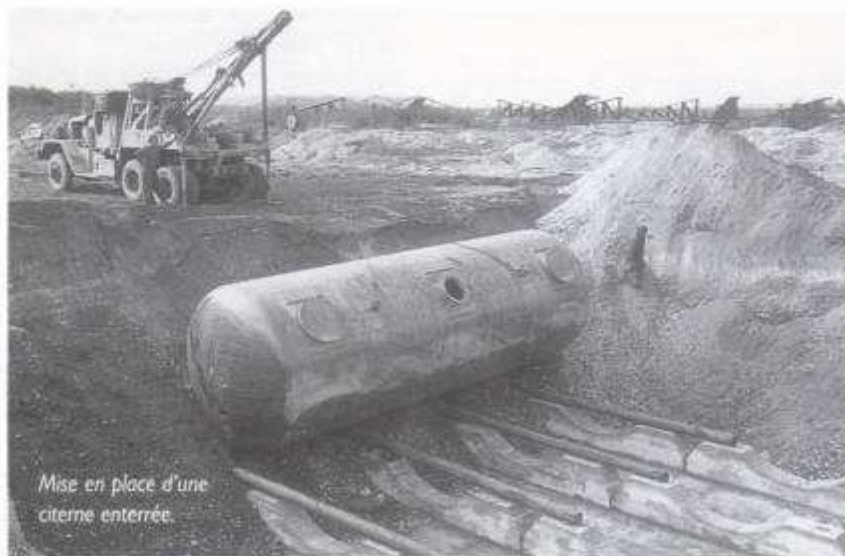
Mise en place d'une citerne enterrée.

Le 6 juillet, eu lieu la réception provisoire du Banc d'essai réacteur.