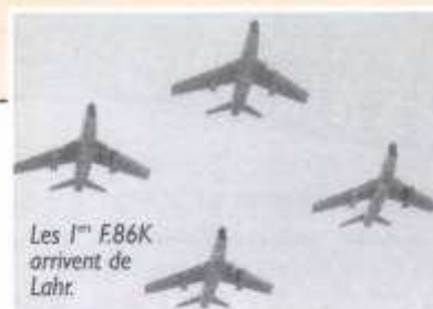
Les 1 er F.86K arrivent de Lahr.

La mission de la base aérienne d'opérations était dans l'ensemble identique à celle de toutes les bases situées sur le territoire français. Cependant, elle avait une caractéristique particulière " la Chasse Tout Temps ". Grâce au matériel nouveau qui imposait aussi bien à l'Escadre qu'au personnel de la base des techniques nouvelles, des méthodes et des habitudes de travail différentes de celles des autres unités spécialisées dans la reconnaissance ou le bombardement.