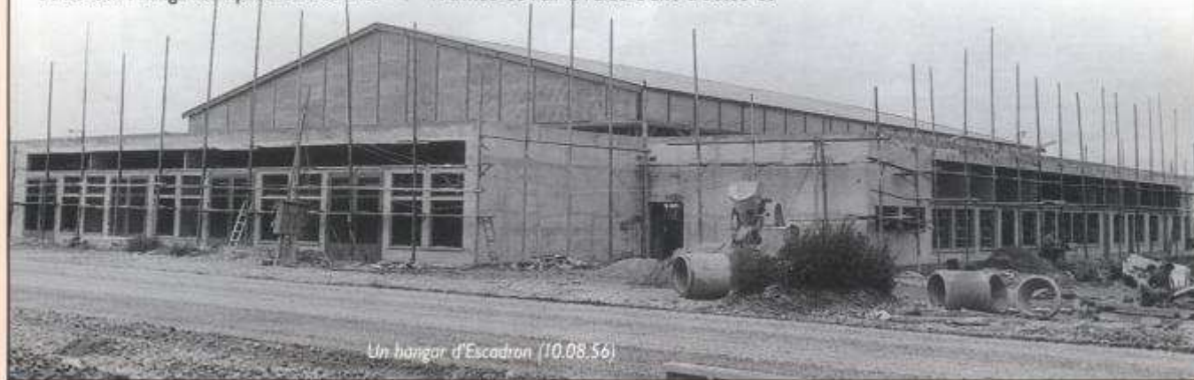
Un hangar d'Escadron (10.08.56)

Le 15 novembre les travaux du château d'eau étaient terminés. L'entreprise avait exécuté ces derniers dans les règles de l'art avec le souci d'obtenir une finition parfaite grâce à une direction technique très qualifiée.