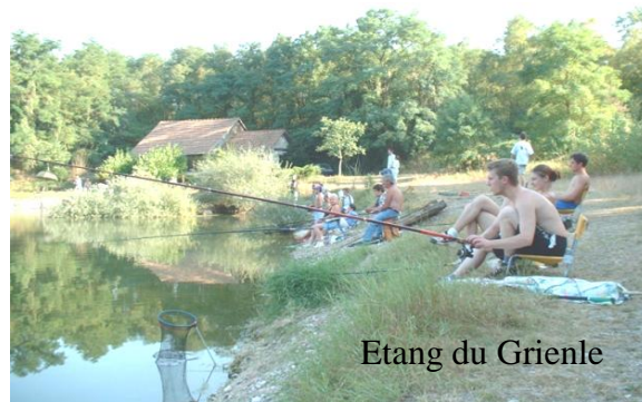
Etang du Grienle