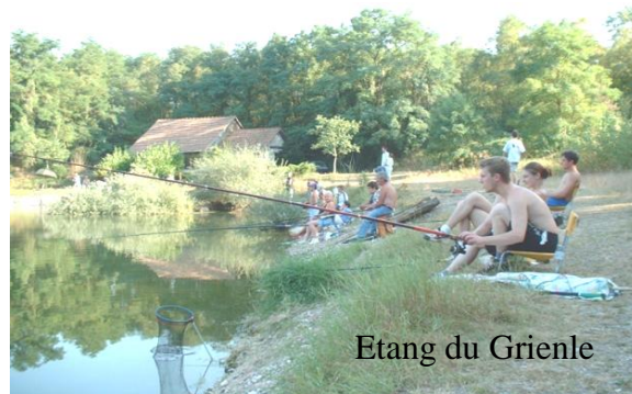
Étang du Grienle