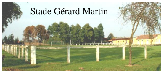
Stade Gérard Martin