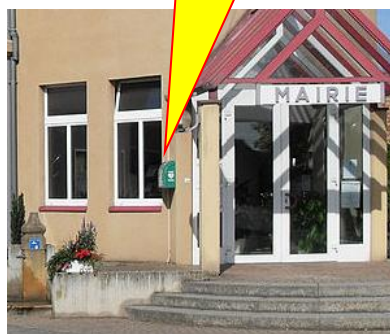
Dépôt d'incendie Niederentzen-Oberentzen