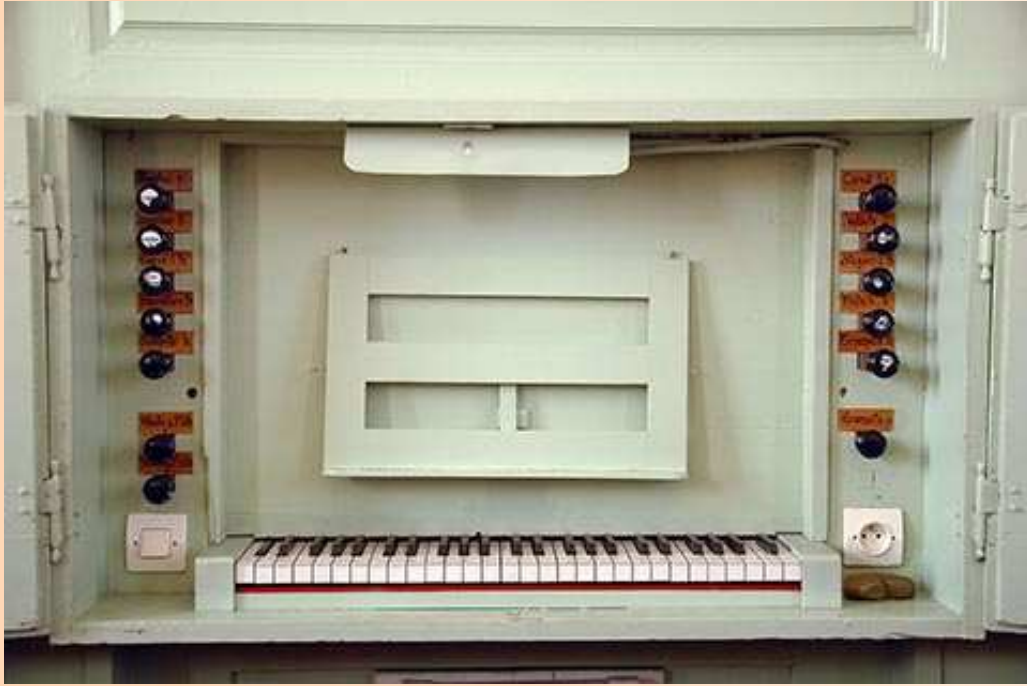
La console en fenêtre.

Console en fenêtre frontale. Clavier (blanc) et pédalier de Berger (1892). Tirants de jeux de section carrée, munis de tirants "fin 19ème" tournés et munis de porcelaines. Elles paraissent être de Berger. De façon inexplicable et absurde, elles ont été badigeonnées d'une peinture noire, aujourd'hui partiellement écaillée et qui laisse apparaître la vraie nomenclature des jeux. Des "étiquettes" bricolées font apparaître des noms de jeux fantaisistes. La console est de plus affublée d'équipements électriques indignes d'un meuble historique (on peut imaginer ce que cela suppose en matière de perçage, derrière). Un trou carré rebouché peut correspondre à un tirant de tremblant. Deux trous correspondant à des chandeliers sont toujours visibles. Banc récent.