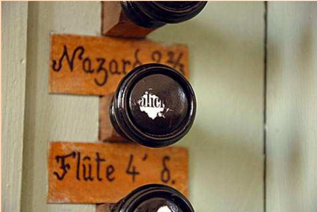
Le tirant du Salicional, barbouillé de peinture noire,

Console en fenêtre frontale. Clavier (blanc) et pédalier de Berger (1892). Tirants de jeux de section carrée, munis de tirants "fin 19ème" tournés et munis de porcelaines. Elles paraissent être de Berger. De façon inexplicable et absurde, elles ont été badigeonnées d'une peinture noire, aujourd'hui partiellement écaillée et qui laisse apparaître la vraie nomenclature des jeux. Des "étiquettes" bricolées font apparaître des noms de jeux fantaisistes. La console est de plus affublée d'équipements électriques indignes d'un meuble historique (on peut imaginer ce que cela suppose en matière de perçage, derrière). Un trou carré rebouché peut correspondre à un tirant de tremblant. Deux trous correspondant à des chandeliers sont toujours visibles. Banc récent.