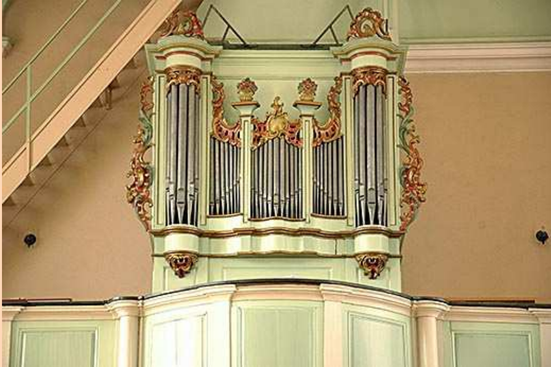
Oberentzen, le buffet de Louis Dubois.

25/07/2012.