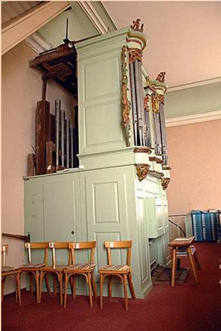
L'orgue vu de côté.

Ce joli petit buffet rococo date bien de 1759. La façade, d'origine, est constituée de 37 tuyaux : 8 chanoines, 8 tuyaux de Doublette (C-G) et 21 tuyaux de Prestant 4 (C-gis). [RLopes]