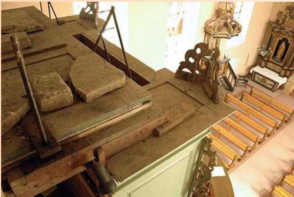
La curieuse disposition du réservoir.

Les pièces noires saillantes sont les pantographes, destinés à maintenir la table supérieure (mobile) horizontale. (Comme elle est lestée de pierres, il vaut mieux... surtout dans cette configuration !)